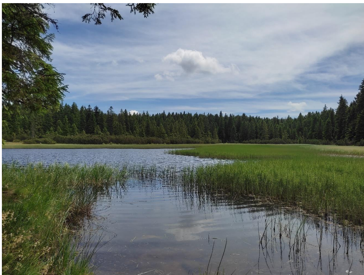
Slika 2: Črno jezero

Območje Črnega jezera je zaradi edinstvenega ekosistema visokih šotnih barij zavarovano in pri ogledu velja poseben naravovarstveni režim, prepovedano je kampiranje in kurjenje odprtega ognja.