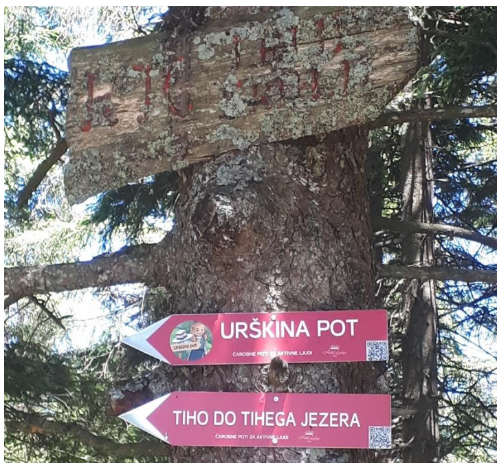
Slika 6: Smerokaz za Urškino pot in pot do Tihega jezera

Okoli jezera je travnik, ki je idealen za poležavanje ter igro na soncu.