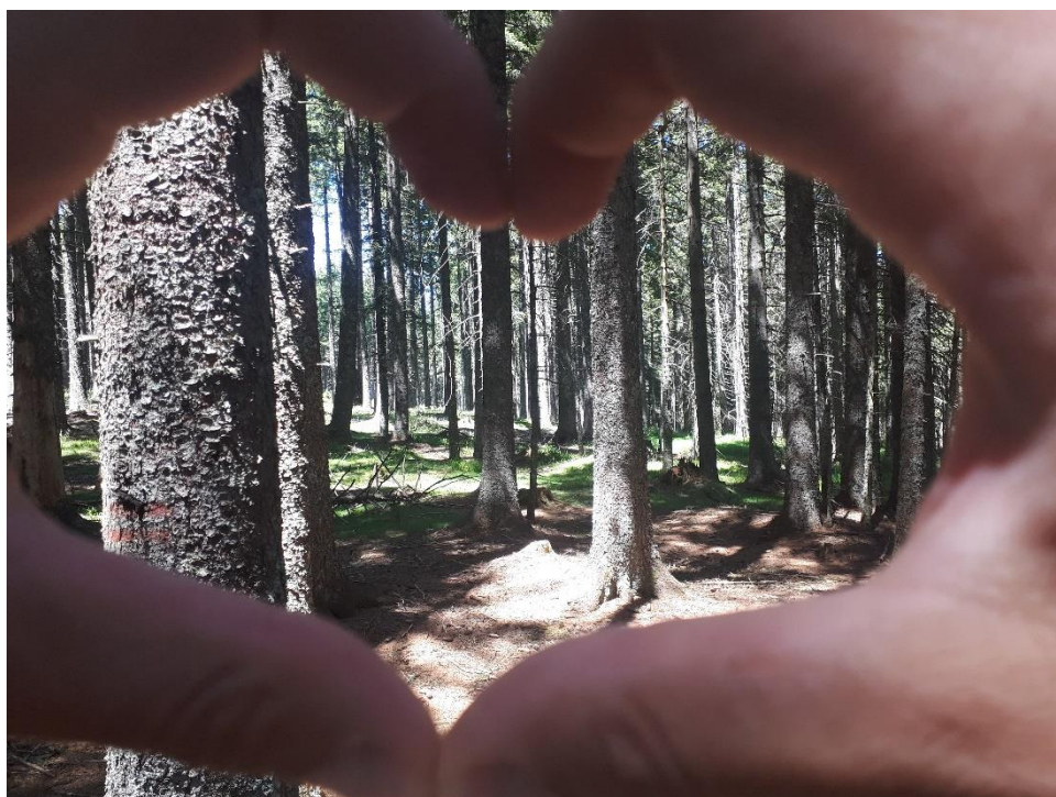
Slika 7: Pogled na Urškino pot

Urškina pot ima prav posebno zgodbo, katera naj bi bila po mnenju naših prednikov resnična. Seveda zgodbe ne bomo izdali, saj jo lahko odkrijete sami. Lahko pa povemo, da je bila Urška deklica, ki je prodajala vžigalice. Kaj se je zgodilo potem? Na Treh Kraljih v hotelu Jakec na recepciji prosite za brošuro Urške ter kartonček za zbiranje žigov na Urškini poti. Na vsaki izmed postojank poskenirajte QR kodo in Urška vas bo povabila na pot. Med potjo boste videli prelepe barve narave in spoznali boste zgodbo o Urški ter usodo pohorskega bataljona. Pot je markirana in zelo poučna. Šli boste mimo Črnega jezera, kjer se boste sprostili v objemu narave in videli nekatere živali.