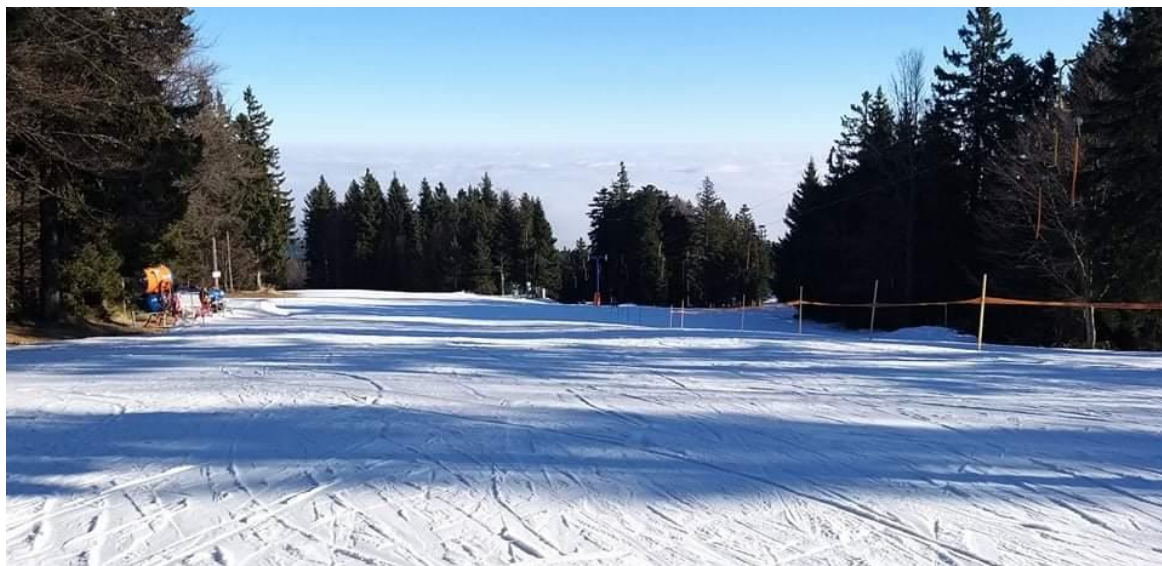
Slika 8: Smučarski užitki

V bližini Črnega jezera se nahaja smučišče RTC Trije kralji. Med zimsko sezono lahko smučamo in sankamo, obkroženi s čudovito naravo. V primeru, da nam kateri od zimskih športov ni všeč, se lahko odpravimo tudi na daljši pohod.