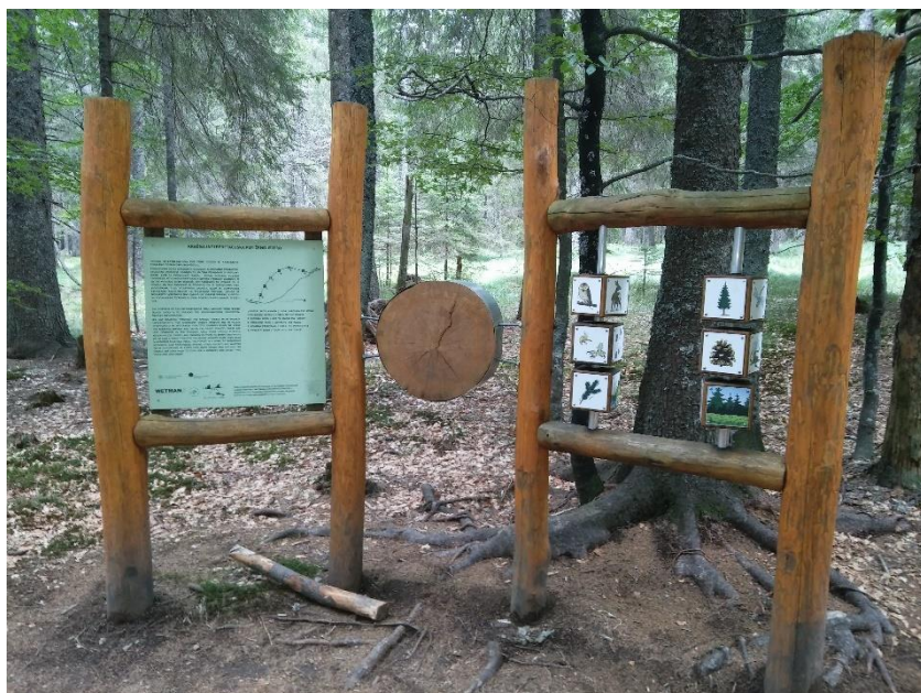
Slika 3 in 4: Čutna učna pot na poti do Črnega jezera