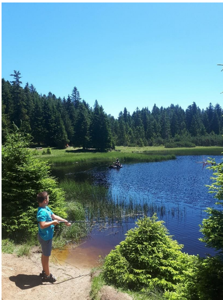
Slika 5: Muharjenje na Črnem jezeru

V Črnem jezeru najdemo le endemsko vrsto potočne postrvi, ki je črne barve z izrazito rdečimi pikami. Dovoljeno je samo muharjenje, kar pomeni, da lahko za vabo uporabimo umetne muhe. Za muharjenje uporabljamo muharico, to je ribiška palica, katero uporabljamo za lovljenje rib na muho. Ribišstvo je dovoljeno čez cel dan. Ob koncu ribolova moramo ribe vrniti nazaj v vodo. Ribolov velja za enega izmed najbolj sproščujočih športov.