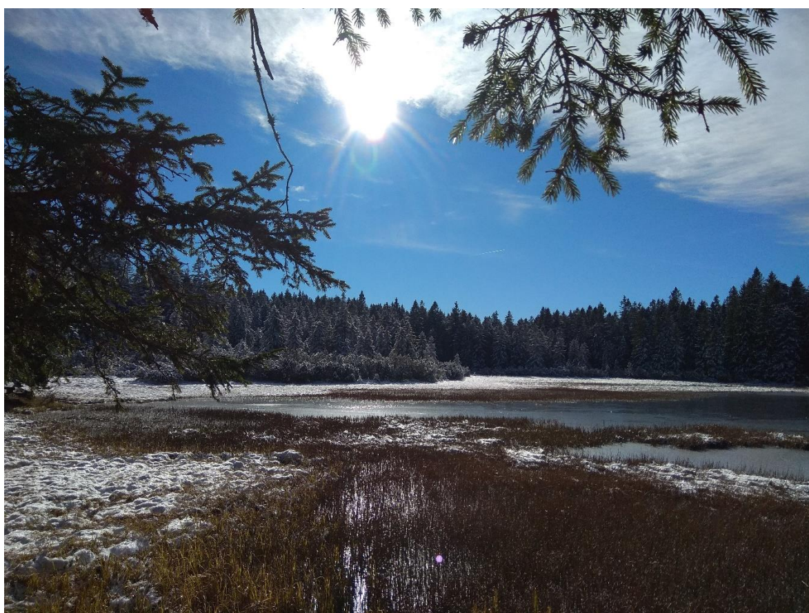
Slika 1: Črno jezero pozimi

Zakaj se imenuje Črno jezero? Kaj nam okolica Črnega jezera ponuja? Zakaj bi lahko bilo Črno jezero zdravilno? Na vsa ta vprašanja boste dobili odgovore. S pomočjo domačinov in vseh ostalih virov, katerim se iskreno zahvaljujemo, smo zapisali nalogo, s katero upamo, da bi pomagala turistom in vsem ostalim spoznati našo okolico, dobiti idejo za izlet, se več gibati v naravi, se v njej sprostiti, v njej prenočiti, jo spoštovati ter ohranjati njene vire.